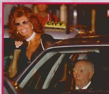
A szálloda – Külön aludtak az örömszülők 54-55. oldal