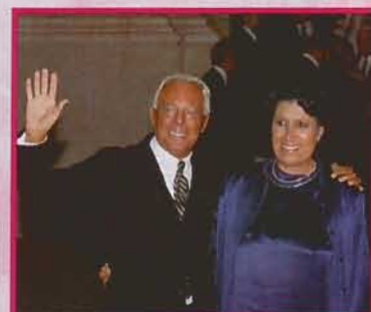
A vacsora – Armani elrepült két fogás között 56-57. oldal