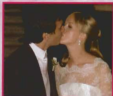
Az esküvő – Olaszul mondták ki az „Igen”-t 8-9. és 52-53. oldal