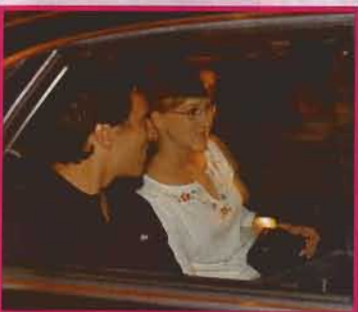
A próba – Kidobták a zenészek kottáit 6-7. oldal

Magazinunk az álomesküvő minden helyszínére bejutott! Ott voltunk a Bazilikában a főpróbán és az esküvőn, a hírességeknek helyet adó Four Seasons szállóban, embereink és informátoraink bejutottak a lakodalom helyszínére is.